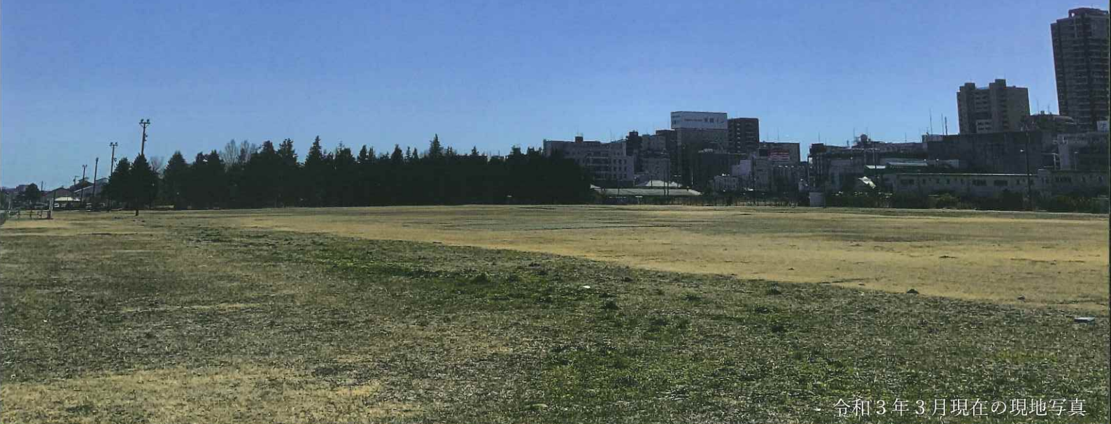
令和3年3月現在の現地写真