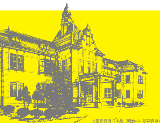
北里研究所旧本館 (明治村に移築保存)