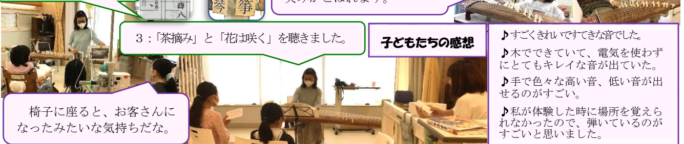
椅子に座ると、お客さんになったみたいな気持ちだな。