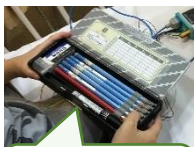
ピカピカの 1年生の筆箱

「明るく 強く 根気よく」は、北里学級の学級目標です。今年度も皆それぞれ、自分の体調や気持ちと向き合いながら、「明るく 強く 根気よく」学習に取り組んでいます。