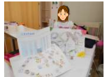
このトランプ、すごろく、楽しそう！