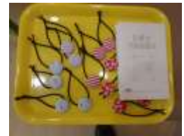
2組のメッセージを掲示板に！