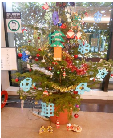
エレベーターホールに飾りました

今年も北里大学病院の総務課、管理課の皆さんが、大きなもみの木を用意して下さいました。小児病棟や北里学級また、入院されている皆さんで、飾り付けを楽しみました。学級や小児病棟で制作したアクセサリ、オーナメント。それに、きれいなイルミネーションやモールを合わせて、レイアウトを考えて、取り付けました。大きなもみの木なので、たくさん飾ることができました。