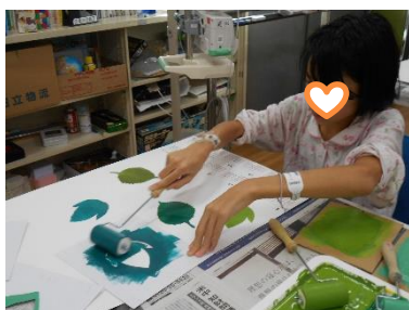
ローラーで刷りました

てっぺんに大きなポーラ・スターのついたクリスマスツリーは、サンタクロースの道しるべ。これで、サンタクロースが小児病棟や北里学級まで迷わずにやって来れそうです。みなさんはクリスマスプレゼントに何が欲しいですか。サンタさん宛てのクリスマスカードに、名前と欲しいものをしっかり書いて、ぶらさげておくと、もしかしたら??? 願いはかなうかもしれませんね。一度、ためしてみてもはどうでしょう。