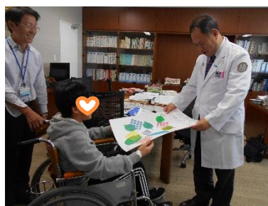
病院長先生へプレゼントしました