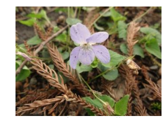
タチツボスマレ 葉がハート形のスマレ