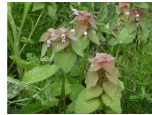
オドリコソウ ホトケノザと似ている