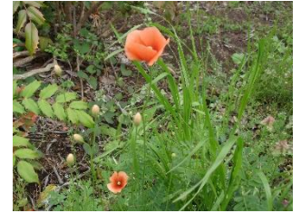
ナガミノヒナゲシ 地中海沿岸が原産地 実が細長い