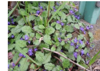
キランソウ 茎が地面を這いながら増える