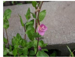
ユウゲショウ タ方きれいに咲くからこの名前？