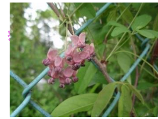
アケビ 実は二つに割れ食べられます なるかな？！