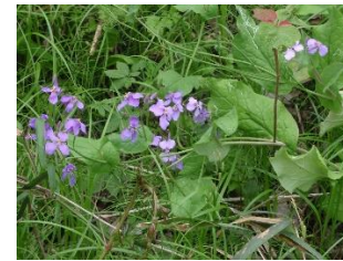
ムラサキハナナ 正式名オオアラセイトウ