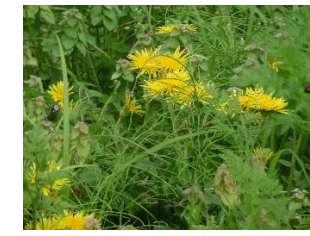
カントウタンポポ 日本生まれ 裏にあるガクが直立