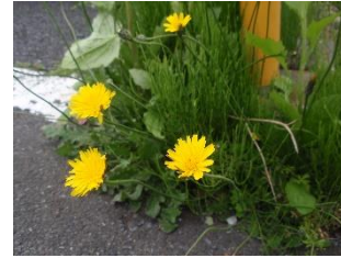
ブタナ タンポポと似てるけど茎が長い 外来種