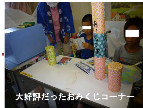
大好評だったおみくじコーナー

中学部学習予定…五教科を中心に実技教科にも取り組みます。さまざまな教材を使って、勉強の楽しさが伝わるように頑張ります。入院中に得意な教科を増やしてしましましょう。10月には麻溝台中学校でおこなわれる「学習発表期間」にも参加します。